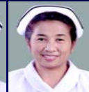
เย็นฤดี (เย็น)