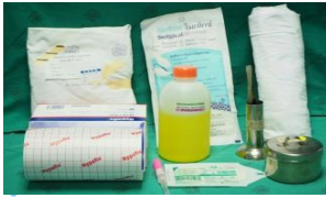
อุปกรณ์สำหรับแพทย์แทง