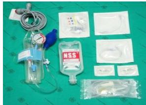
อุปกรณ์สำหรับ monitor